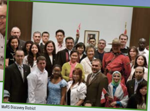
MaRS Discovery District