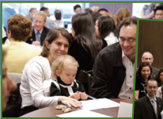
MaRS Discovery District